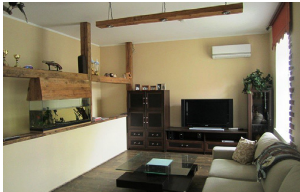
Suurepärase planeeringuga avar korter Rakveres Pikal tänaval

• Maade ja majade müügipakkumiste hulk oli detsembri lõpus portaali kv.ee andmetel ca 60 objekti, mis on viimaste kuude kõige väiksem arv.