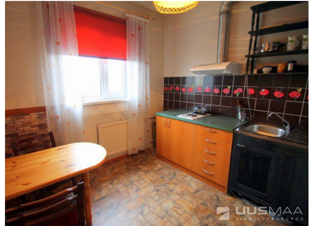
1-toaline korter Võrus Koreli tänaval.

Võrus oli detsember 2011. aasta rekordkuu.