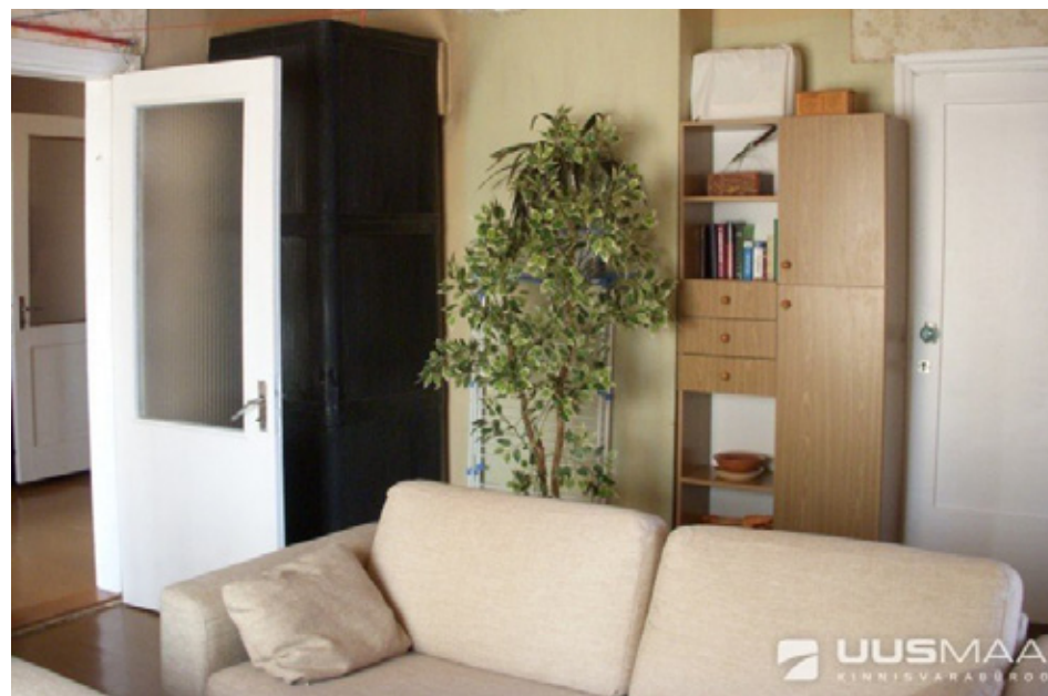
Ahiküttega majaosa Viljandis Uuel tänaval

Küttekulude kallinemise tõttu on Viljandis nõutud ahiküttega üürikorterid.