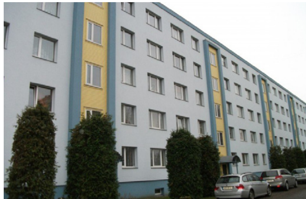
Kaunilt renoveeritud kortermaja Pärnus Mai tänaval.

• Eramute ja kruntide turg on talviselt vaikne ning praegused prognoosid näitavad niisuguse seisu jätkumist