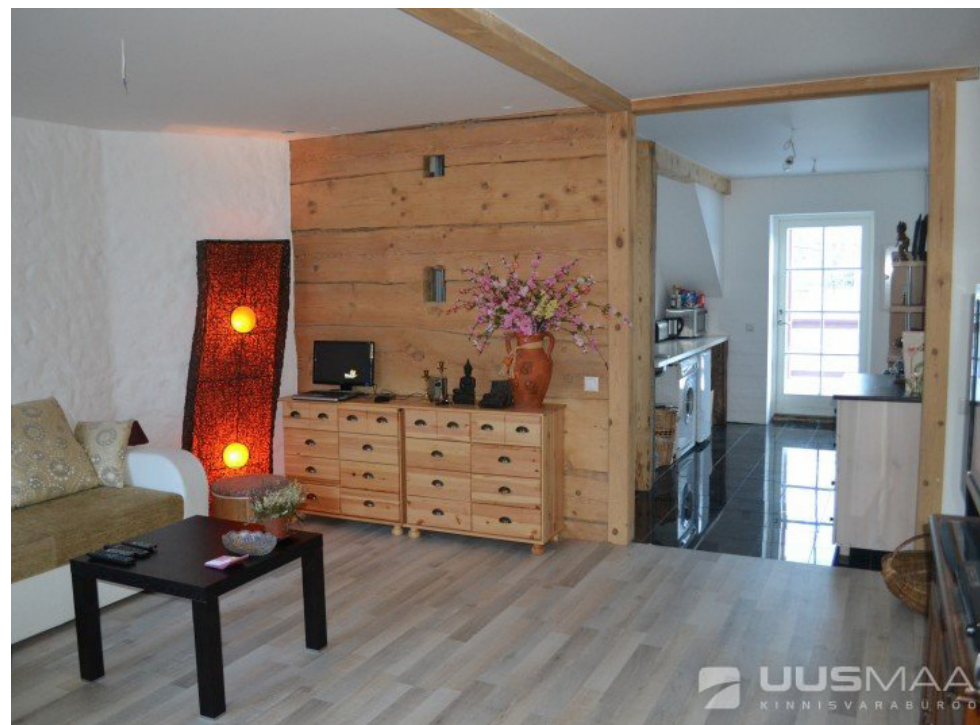
Heas korras korter Kuressaares Pärna tänaval

Müüjad on hakanud kergemalt hinnaalandusi tegema, sest oodatud hinnatõusu pole näha.