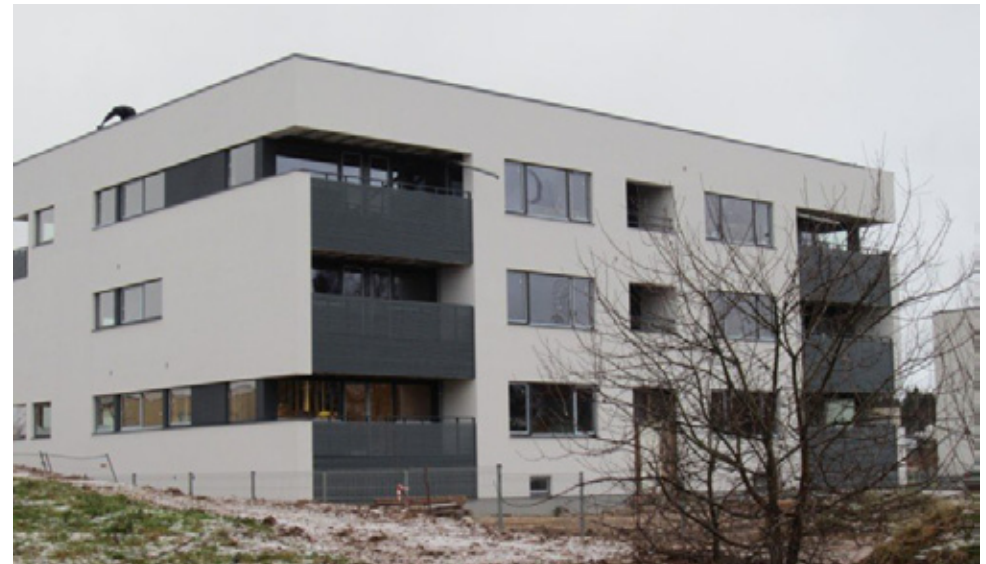
Uhiuus kortermaja Tartus Tammelinnas Kulli tänaval