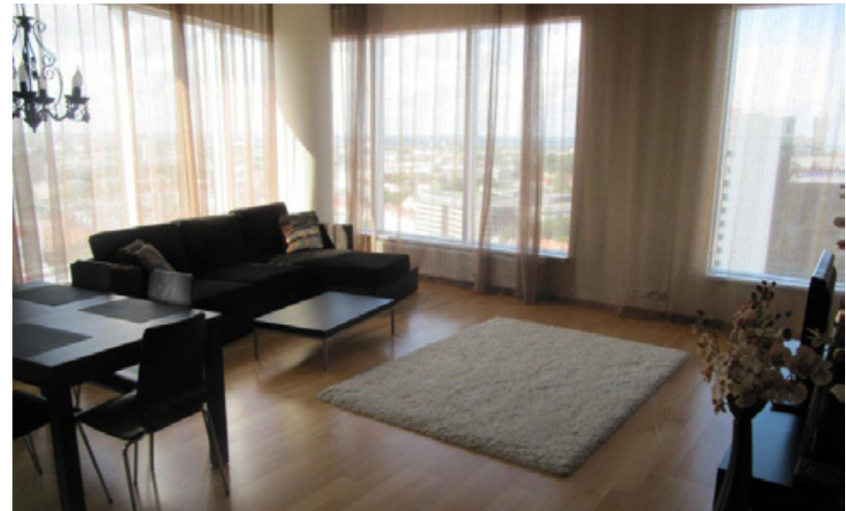
3-toaline korter Tornimäe korterelamu 21.korrusel